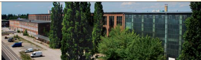
Produktions- und Lagerhalle Gebäude 23 10.000 m 2