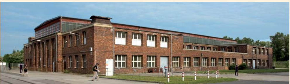
Produktions- und Lagerhalle Gebäude 11 6.000 m 2